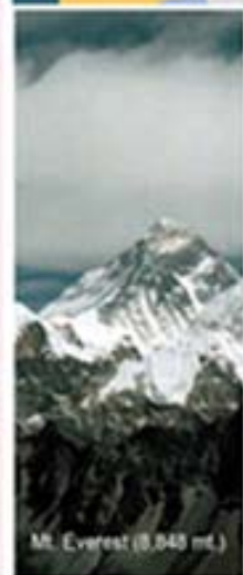
Mt. Everest (8,848 m.)

The biggest natural museum in the world with treasures full of natural wonders covers a span of 147,181 sq. kms of varied topography provides home to wildlife and different species of insects and birds with panoramic mountains, mid hills, valleys and plains endowed with rich flora and medicinal plants; perennial rivers, lakes and glacial lakes. The country has wide biodiversity and affluent heritage with varied socio cultural dimension, the anthropologists claim as melting pot of Hindu and Buddhist culture.